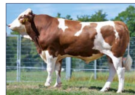
BFG Verden PS